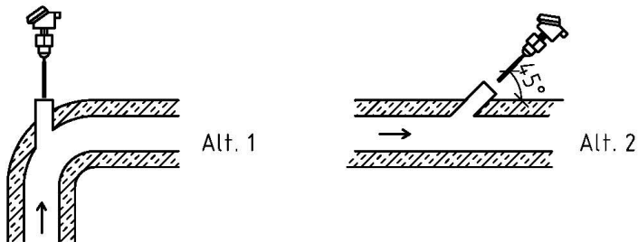
Bild 3 MONTAGE AV TEMPERATURGIVARE